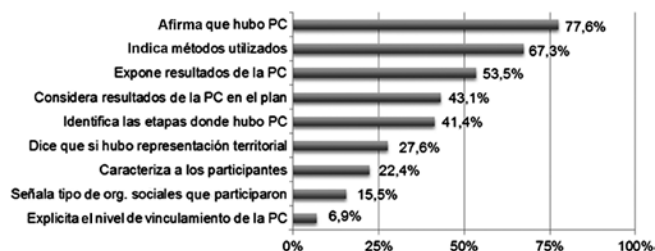
FIGURA 4. PARTICIPACIÓN CIUDADANA.

ítems que fueron cubiertos por al menos más de la mitad de la muestra corresponden a que el PLADECO señala los métodos utilizados 45 (67,3%) y que expone resultados del proceso participativo (53,5%). Por su parte, la identificación de cuándo hubo participación (en qué etapas) y la consideración de la participación en la planificación 46 fueron ítems cubiertos por alrededor de un 40% de los documentos revisados. Para todos los demás ítems evaluados, tales como explicitación del nivel de vinculación 47 , identificación de las organizaciones sociales que participaron 48 , caracterización de los participantes 49 y explicitación de si hubo representación territorial 50 , la cobertura fue menor al 27% (figura 4).