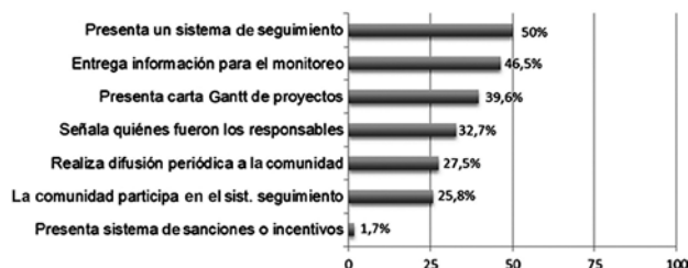
FIGURA 5. ACCOUNTABILITY.