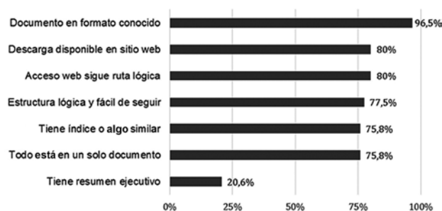
FIGURA 6. ACCESIBILIDAD.